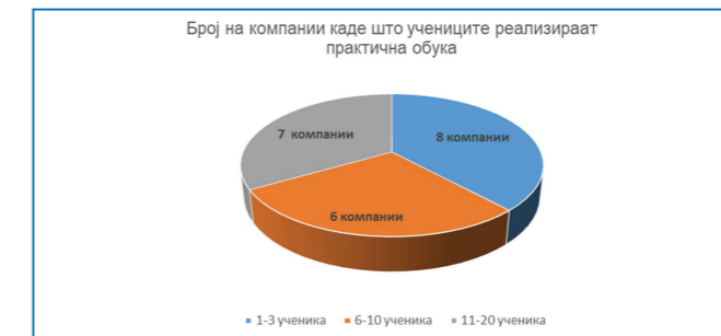
Графикон бр. 2

Овој индикатор покажува дека компаниите се охрабруваат да го зголемат бројот на ученици кои реализираат практична обука во нивните организации и дека разбираат оти самите мора да го подготвуваат кадарот.